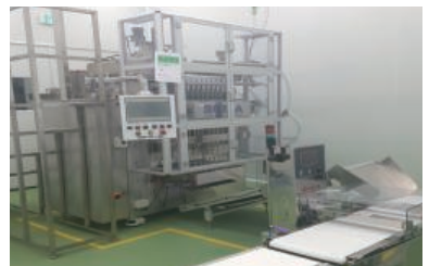
10-Lane Powder Stick Baler System 10열 분말 스틱 포장기