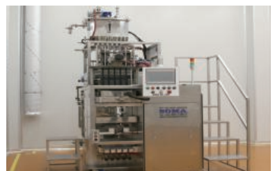
Liquid Stick Packaging Machine 액상 스틱 포장기