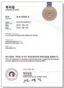
▲ 특허등록 제 10-1495682호 (효소처리 및 분무건조공법을 이용한 식물향미소금의 제조방법) Patent Registration No. 10-1495682 (Manufacturing method of herb-flavored salt using enzyme treatment and spray-drying technique)