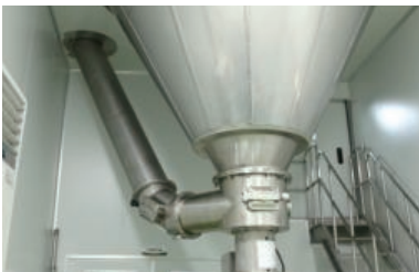
Spray-Drying Chamber and System 생산용분무건조장치

300kg/hr, 120kg/hr(Standard : quantity of evaporation) (300kg/hr 증발량기준, 120kg/hr 증발량기준)