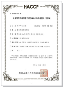
▲ HACCP 인증서 HACCP Certification