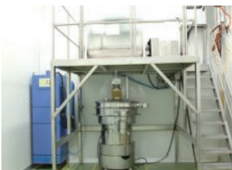
Ribbon Mixer(Mixing Powder) 분체혼합(리본믹서기)