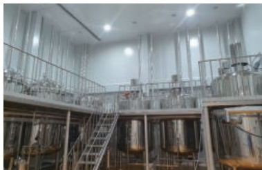
Extraction Tank and Concentration Tank 추출조 및 농축조

Extraction System 5,000Lit / batch 4set 추출시스템 5,000Lit / batch 4set