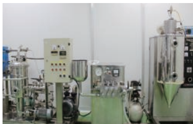
PILOT System PILOT 시스템