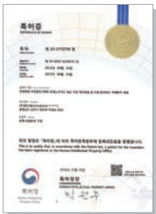
▲ 특허등록 제 10-1772759호 (안정화된 무정형의 20(R)-진세노사이드 Rg3 제조특허) Patent registration no. 10-1772759 (Manufacturing patent for stabilized amorphous form of 20(R)-ginsenoside Rg3)