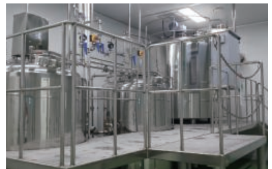
Liquid Mixing Tank 액상혼합조

Extraction System 5,000Lit / batch 4set 추출시스템 5,000Lit / batch 4set