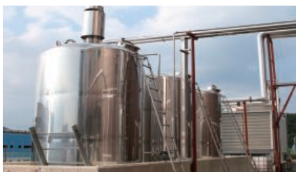
Storage Tank 저장탱크