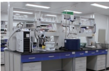
R&D Lab 연구소